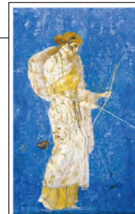
Diana - Villa di Arianna Stabiae, II sec. d.C. Emorragia e trombosi: Le sfide diagnostiche e terapeutiche attuali 25-26 novembre, 2-3 dicembre 2011