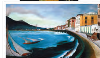
Castellammare di Stabia - Tivadar Kosztká Csontváry, 1902 Museo Csontváry, Pécs, Ungheria BLEEDING & THROMBOSIS CARE 2014 Linee guida e percorsi nella pratica clinica 11-13 dicembre 2014