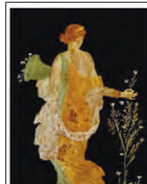
Flora - Villa di Arianna Stabiae, I sec. d.C. Le emorragie della donna In età fertile: tra fisiologia e Patologie dell'emostasi 5-6 novembre 2010