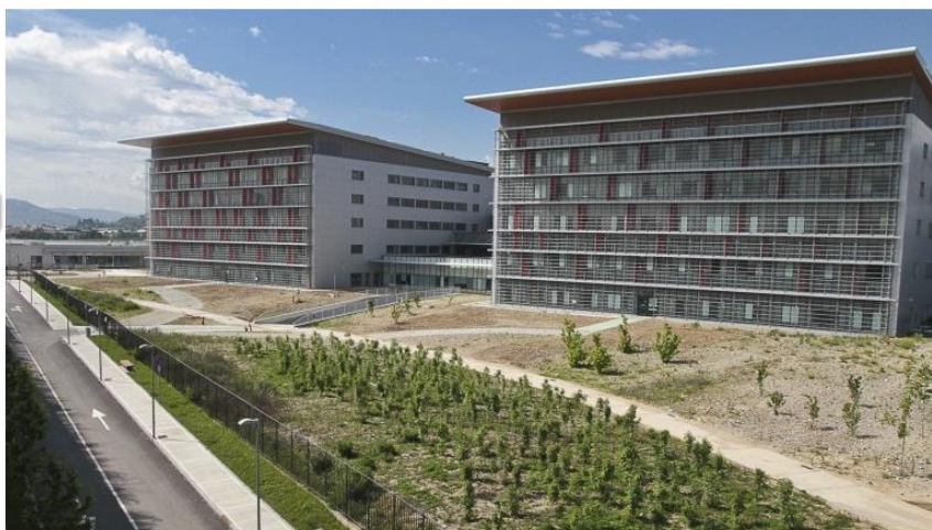
L'ospedale di Bergamo

Di Redazione | 26 gennaio 2016 | Dimensione testo | Stampa questo articolo | Send by Email