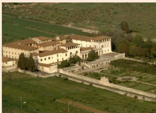
Firenze - Villa La Quiete